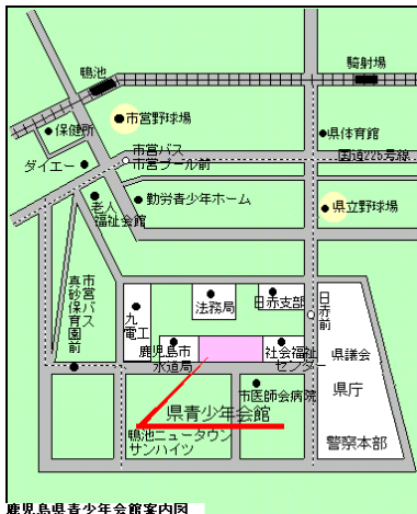
鹿児島県青少年会館案内図